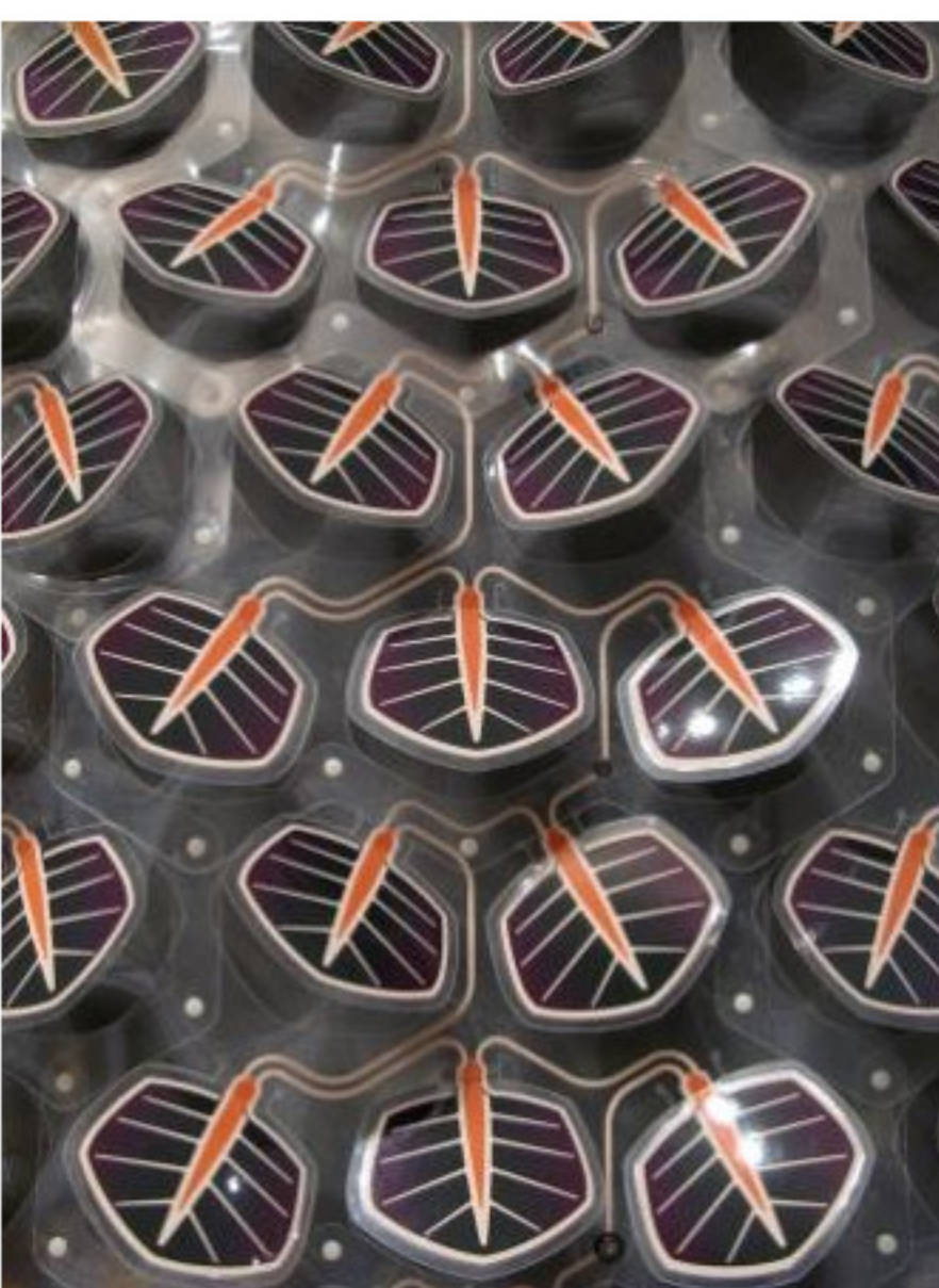
Grow van SMIT