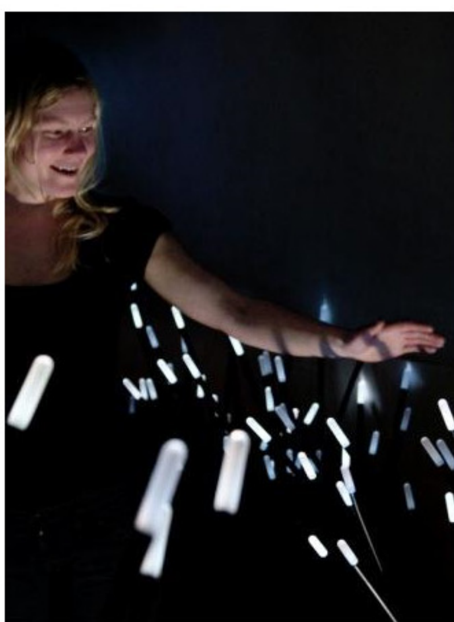
Dune van Daan Roosegaarde

Voor uiteenlopende industrieën is innovatieve ontwikkeling van (intelligente) materialen van groot belang, inmiddels ook niet meer in de laatste plaats vanwege "duurzaamheid". Het platform Material Sense speelt daar voor het zesde achtereenvolgende jaar op in. De reizende materialenexpositie Responsive is als eerste te zien met een teaser op het CeBIT in Hannover, 's werelds grootste ICT-beurs, van 3 t/m 7 maart, in Hall 26, stand A70. Daarna met ruim 30 producten en installaties naar de beurs Material Trends, ook in Hannover.